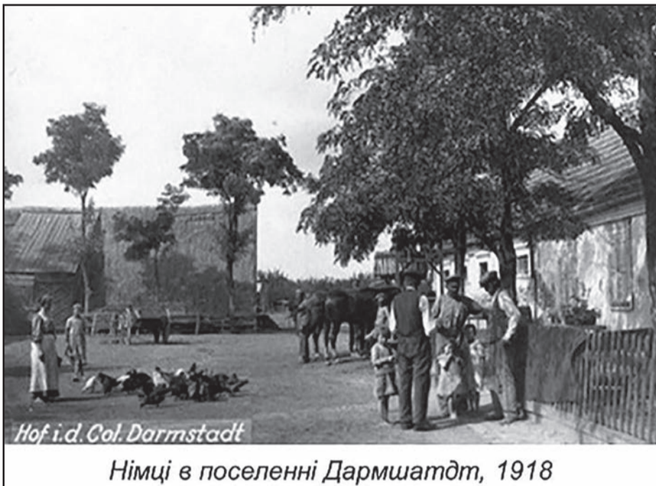
Німці в поселенні Дармштатдт, 1918

Німецькі колоністи користувалися наданими царським урядом пільгами, які гарантували їм виділення земельних наділів у розмірі 65 десятин землі на кожну сім'ю на вигідних умовах, грошову допомогу, свободу релігії та звичаїв, самоврядування, звільнення від сплати податків на термін від 10 до 30 років і від виконання повинностей тощо. Колоністські господарства економічно швидко міцніли. На початку 20 ст. на півдні України німці були власниками 3,8 млн. десятин землі, а на Волині – 700 тис. десятин. Основними галузями господарювання були землеробство, тваринництво, садівництво, лісове госп-во, частково – виноградарство, шовківництво, вирощування тютюну. Внаслідок реформ 1860–70-х рр. виникли великі німецькі фермерські господарства з новими формами господарювання, застосуванням сільськогосподарських машин, передових агротехнічних методів. Створювалися сприятливі умови для розвитку хліборобства, сільськогосподарського машинобудування. 1818 року для управління німецькими колоніями на Півдні України був створений Опікунський комітет. У німецьких колоніях розвивалося громадське життя, кооперативний рух, створювалися аграрні спілки, кредитні установи тощо. У середині 19 ст. в Одесі діяло 9 німецьких цехових управ: слясарна, каретна, столярна, годинникових справ, кондитерська та ін. Німецькі купці здійснювали торговельні операції з європейськими країнами, організували міжнародні товарні перевезення. Діяли пруське, гамбурзьке,